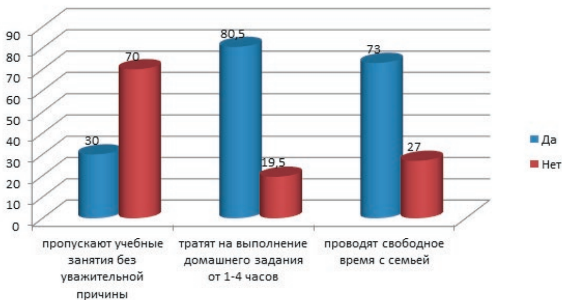
Рисунок 3 – Школьники с нарушениями здорового образа жизни (%)

Интересно отметить, что треть (30,0 %) респондентов пропускают учебные занятия без уважительной причины несколько раз в месяц, 19,5 % тратят на выполнение домашнего задания не более часа, или вообще его не выполняют и 27,0 % учащихся вообще не проводят свободное время с семьей, родителями и родственниками (рис. 3).